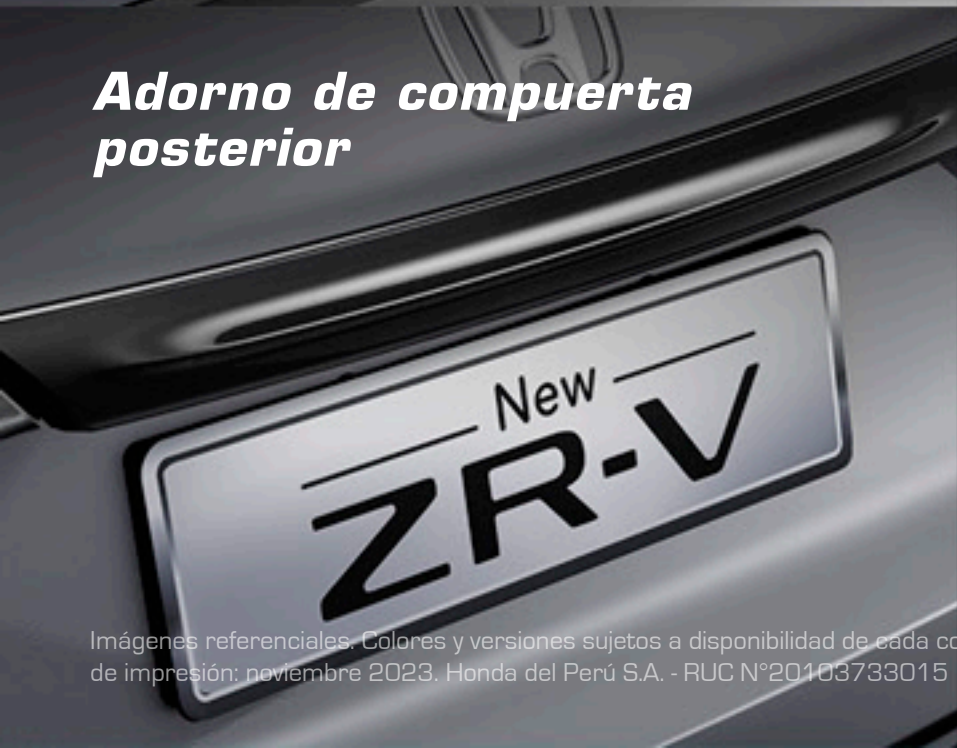
Adorno de compuerta posterior