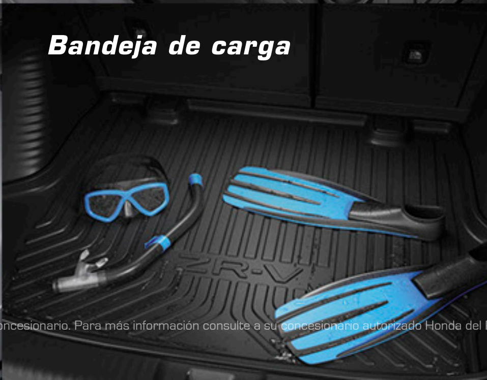
Bandeja de carga